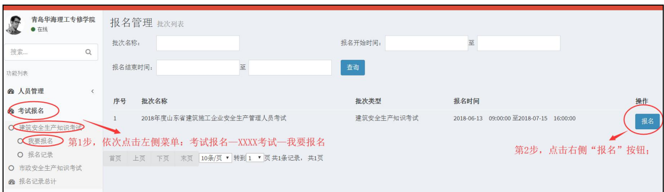
图 5-1 选择要报名的考试批次

说明 2：XXXX 考试，系统内共有两类，建筑现场专业人员能力考试，市政现场专业人员能力考试。