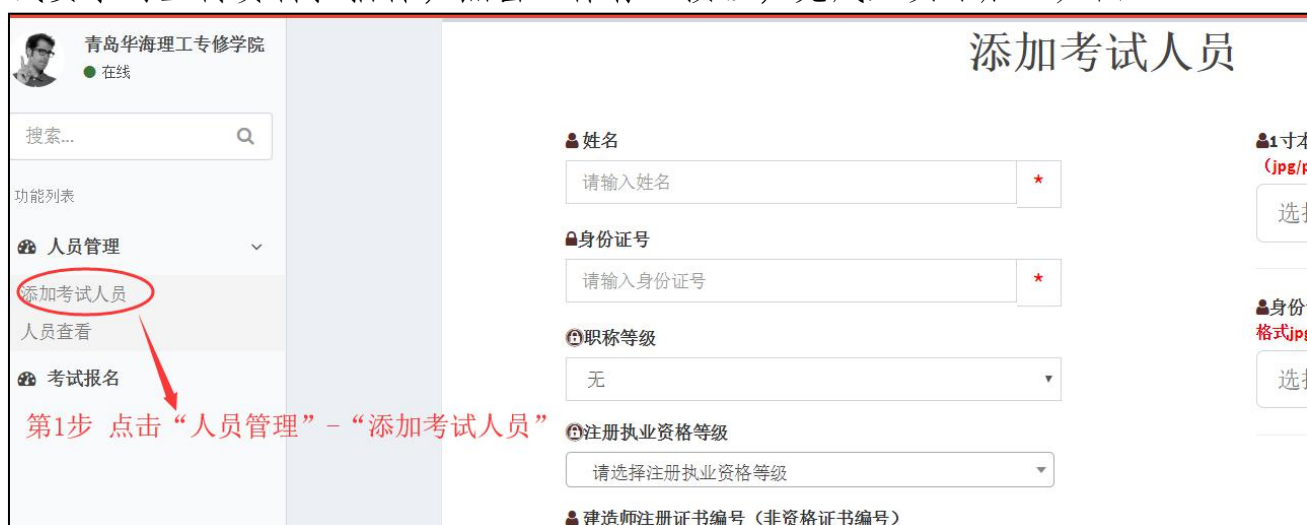
图 4-1 人员管理与添加考试人员菜单

点击“人员管理”菜单下的“添加考试人员”子菜单，打开人员添加操作页面，输入人员相关信息，上传个人照片扫描件、身份证（正反两面）扫描件等考试要求的上传资料扫描件，点击“保存”按钮，完成人员添加。如图 4-1。