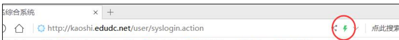
图 1-1 360 安全浏览器的极速模式

请使用谷歌浏览器，QQ 浏览器（极速模式），360 安全浏览器（极速模式），搜狗浏览器（高速模式），百度浏览器（极速模式），极速模式在浏览器“地址栏”右侧的“闪电符号”选择，如图 1-1。