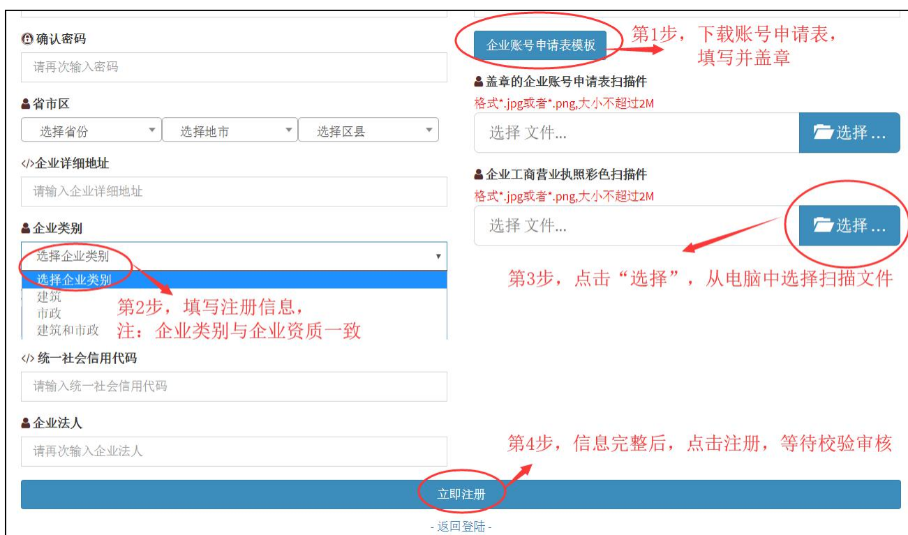
图 2-1 企业注册

在系统首页点击“立即注册”，进入注册信息填报页面，按照要求填写并注册，见图 2-1。